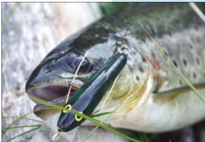
Fjällfisk. Utvecklingsrådet ska bland annat följa jaktens och fiskets utveckling i fjällregionen.