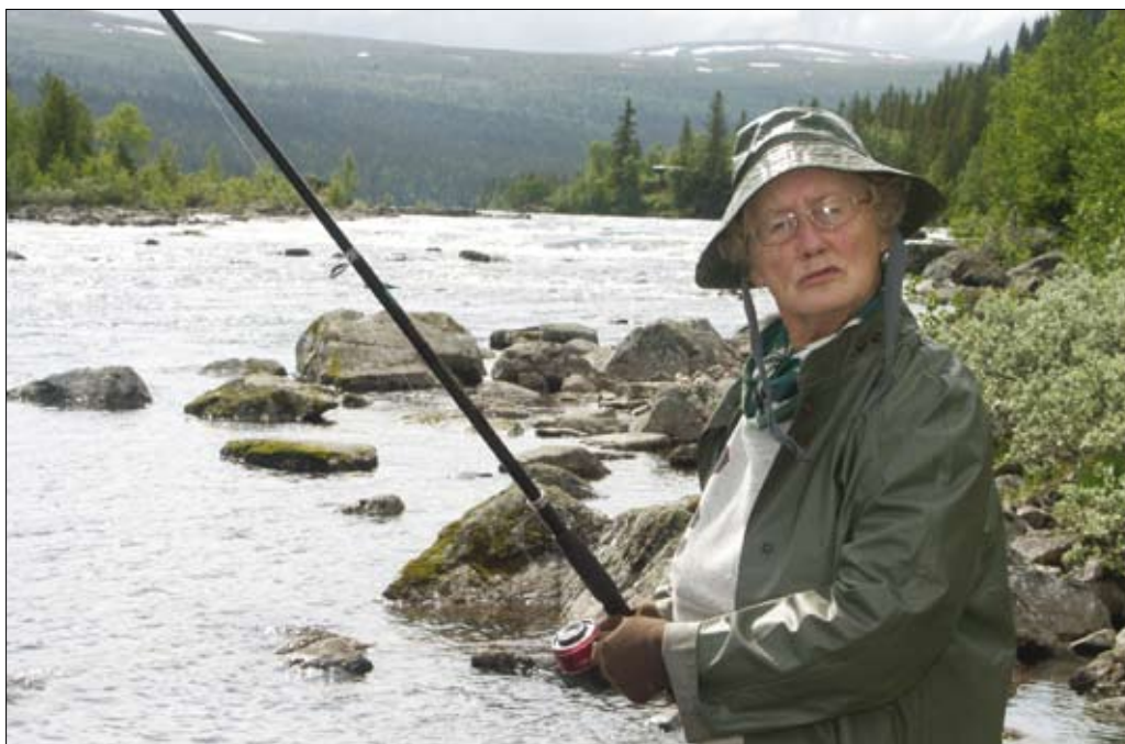
Varför får fisket vänta? Utredningen föreslår att införandet av förslagen skall ske stegvis, med jakten först och fisket sedan.

Finns det någon risk att makten i samverkansföreningarna hamnar hos markägare som inte är lokalt förankrade?