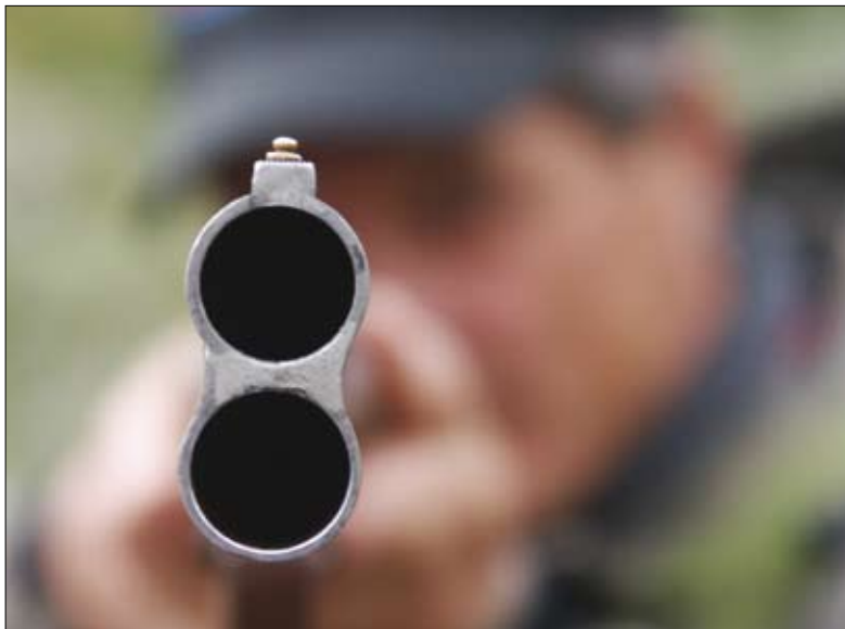
Laddat. Olika grupper uttrycker en djup och stark känsla av att just deras sätt att se på saken är sant och rättvist.

I avsaknad av en klar och tydlig lagstiftning har det allmänna rättsmedvetandet lösts upp. Olika grupperingar har formulerat sina egna rättsuppfattningar, vilka skär sig mot varandra. Det finns till exempel en gruppering som anser att det finns stora marker i lappmarkerna och på renbetesfjällen där samebymedlemmarna över huvud taget inte har någon jakt- eller fiskerätt. En annan grupp erkänner visserligen en delad rätt, men förutsätter att markägarrätten är mycket starkare än samebymedlemmarnas rätt. En tredje