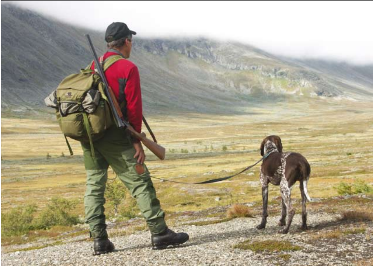
Atråvård jakt. Många vill jaga och fiska i fjällen, men otydliga lagar har lett till delade meningar om hur jakt- och fiskerätten egentligen ser ut. Jakt- och fiskerättsutredningen har försökt reda ut vad som gäller.