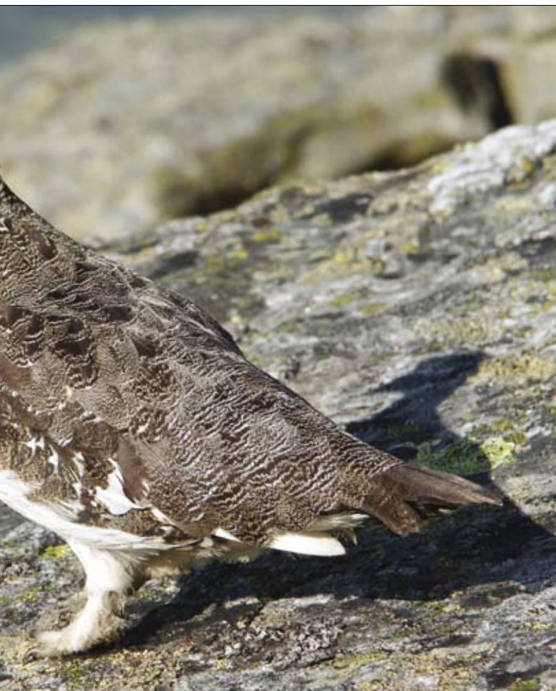
Fjällfågel. Samverkansföreningarna kommer att ha större frihet att styra över älgjakten än över småviltjakten. Utredningen föreslår nämligen endast en organisatorisk förändring av småviltjakten och handredskapsfisket.